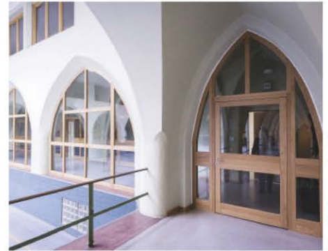
/ Vielfalt bei Formen und Konstruktionen: Moderne CNC-Technologie bietet reichlich Spielraum.