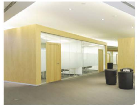
/ Nordemann ermöglicht homogene und durchgängig gestaltete Tür- und Raumlösungen.