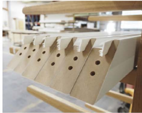
/ ... bei der Massivholzbearbeitung ist man auch für die Plattenbearbeitung bestens gerüstet.