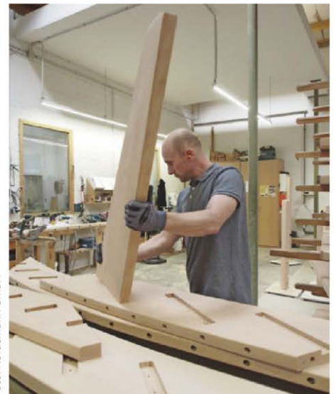
Mehr als 100 Treppen verlassen jedes Jahr die Nordemann-Produktion – Tendenz stark steigend.