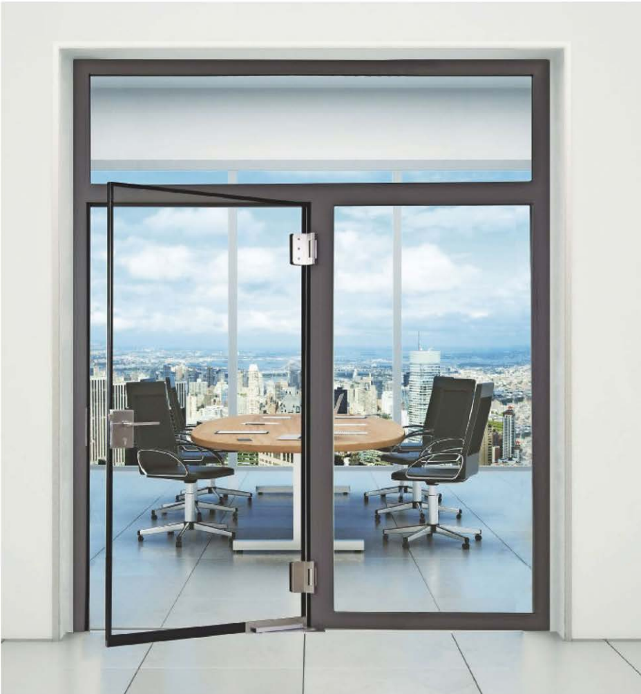
Highlight im Programm ist das Brandschutz-Ganzglastelement Meridian. Abgestimmt auf die vielfältigen Einsatzbereiche, ist es in einflügeliger Ausführung plus feststehenden Seitenteilen und Oberlichtern erhältlich.