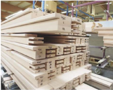
/ Das Unternehmen ist produktionstechnisch vielseitig aufgestellt. Neben ausgeprägter Kompetenz ...